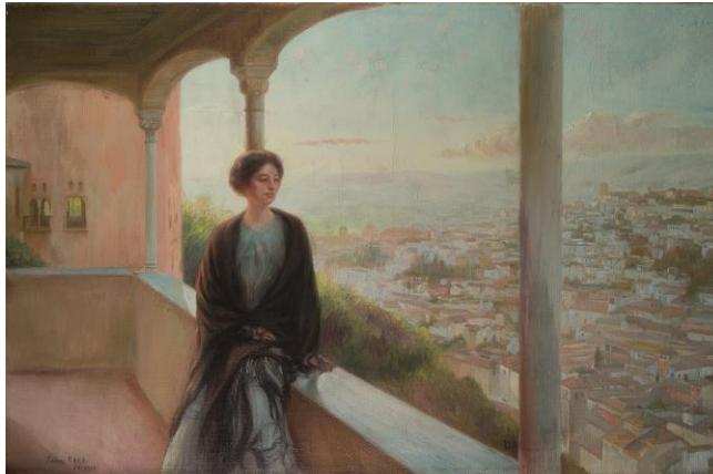
Rêverie, souvenir de Grenade, huile sur toile, 65x92cm

La dite « Belle Epoque » une appellation rétrospective sur une période faste, insouciant et festive. Paris brille sous les feux de l'électricité offrant une expansion à la vie nocturne. La vie culturelle y est trépidante, les boulevards s'animent, Paris est la capitale de tous les possibles.