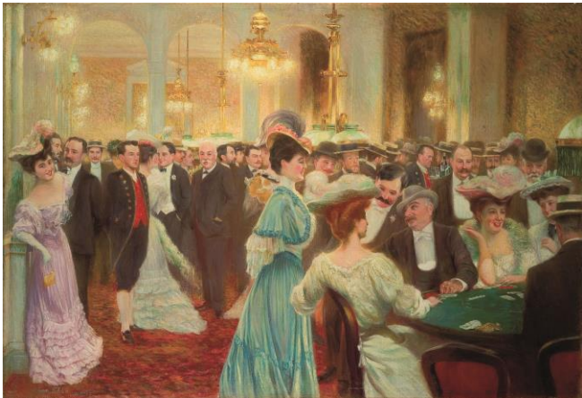
Casino à Dieppe, huile sur toile, 57x83cm

Ces modèles sont autant des intimes que des personnalités du Tout Paris, du monde du spectacle aux notables de la grande bourgeoisie.