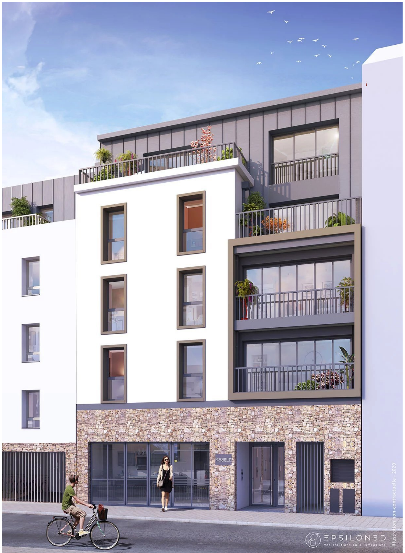
Illustration non-contractuelle - 2020